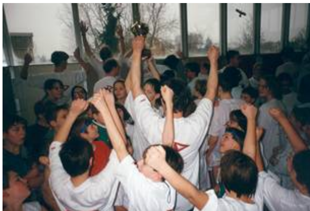
Bild 9: Gothaer und Bruchköbeler Schwimmer beim Schwimmfest des SCUB im Februar 96

unsere Aktiven mit einer großen Mannschaft teil. Auch auf diesem Wettkampf sind unsere Schwimmer