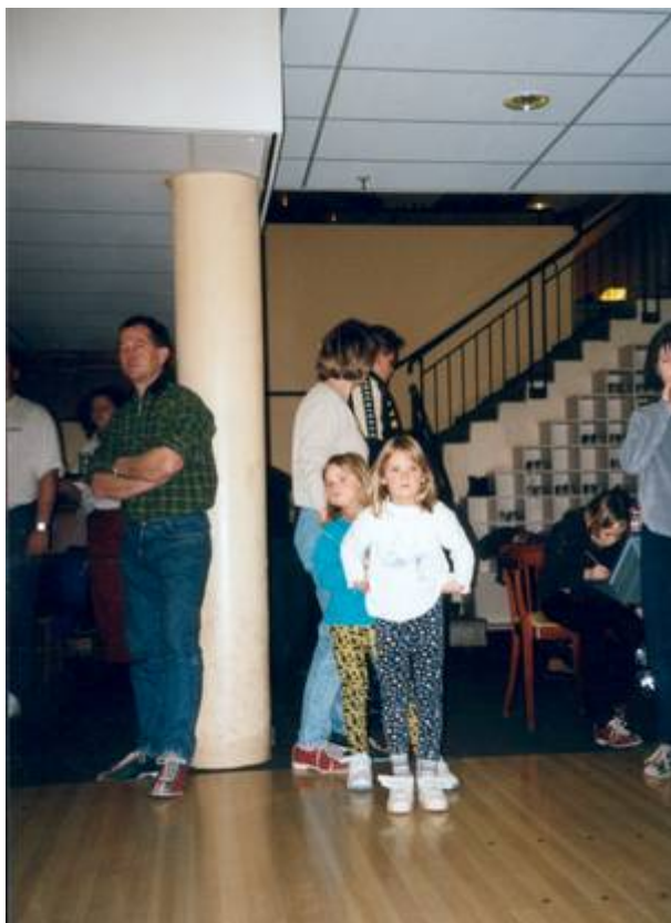
Bild 21: Unsere Jugend und unsere Kinder sind beim Bowlen voll dabei.

Vorjahr hat sich die Teilnehmerzahl vergrößert. Impressionen von dieser Freizeit zeigen Bild 20 und folgende Bilder.